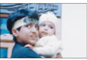
اسدر در سورهی کشته‌می‌شوند)