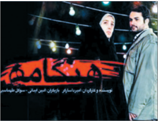
سیدمحمد و فانیان، امیردانشیار وزیران امور اقتصادی و دارایی، امیرسینما -سوتل خندان

امیدوارم شیوه اکران فیلم «هنگامه» موضوع آن که مورد توجه مردم قرار گرفته مسئولان را در مدیریت بر سینما و سینماگران را در انتخاب موضوع برای ساخت اثر به تأمل وادارد.