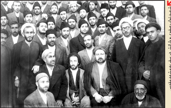
شهید نواب صفوی در کنار پدرش و سایر به‌شهادت‌رسیدگان

یکی از سرگرمی‌های عمده خسروانی و همسرش قمار بود و یکی از معروف‌ترین جلسات قمار در منزل او برگزار می‌شد و وزرا، و کلا و مسئولان عالی‌رتبه کشور در آن شرکت می‌کردند و میلیون‌ها تومان رد و بدل می‌شد. یک بار خسروانی که مبلغ سنگینی را باخته بود، به زور اسلحه پول خود را پس گرفت و کار به دعوا و جنجال کشید و ساواک مجبور شد دخالت کند. خسروانی زندگی خود را روی قمار گذاشت و این موضوعی بود که همسرش هم از آن گله داشت. فساد خانوادگی خسروانی فقط نمونه کوچکی از فساد رژیم غارتگر پهلوی است.