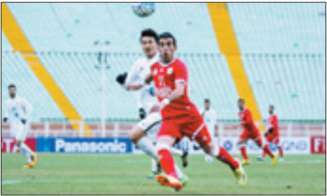
بازیکنان ایرانی در جریان مسابقات لیگ قهرمانان آسیا ۲۰۰۹