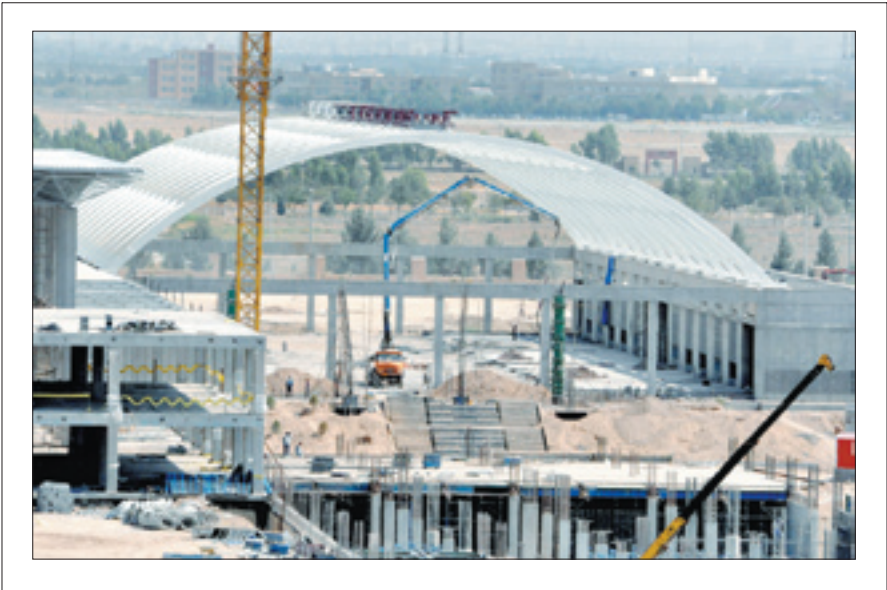
نمای کلی از ساختمان نمایشگاه کتاب