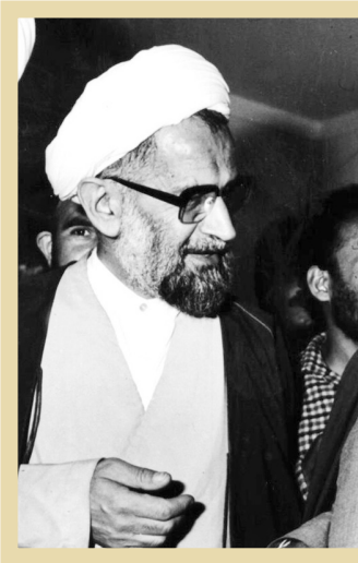
اسفند ۱۳۵۸. ق.م. حجت‌الاسلام شیخ مصطفی ملکی در گفت‌وگو با امام خمینی.

ما به خانه رفتیم، ولی پدرم شب را اصلاً نخوابید