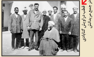
جمع درونشی گنابادی

نشر راه نیکان که تولدش در چنین موقعیتی بود، توفیق و سعادت نشر اثری در این زمینه بسیار مهم را به عنایت الهی که از برکات قرآن و عترت است داشت و البته با تهمت‌های وابستگی فرقه‌ها، خصوصاً رئیس وقت مسلک گنابادی به رسم حزبی گذشته‌اش، نشر مستقل راه نیکان را - که الحق از مصادیق راه نیکان است - هر روز مجری دستورات وژار تخانه‌ای می‌داند تا به خیال خام خود، به بیداری تکان دهنده‌ای که در اتباع فرقه دیده می‌شود، جهت سیاسی بدهد و شاید مانع‌گریز آنهایی شود که پی برده‌اند عمر خویش را بر سر ریاست گروهی نهاده‌اند که انسان‌های صافی دل و پاکبخته را چون میراث مرده‌ای به یکدیگر تحویل داده‌اند. البته