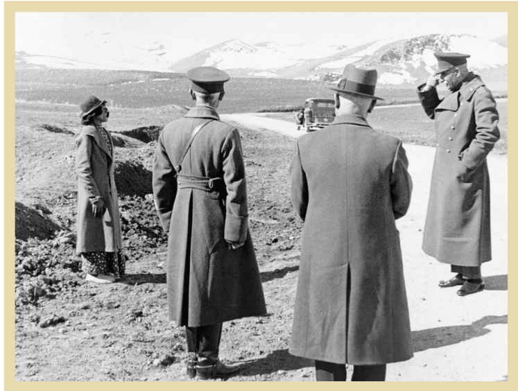
رضاخان در گفت‌ووشویدای یکی از زنان عشایر در حاشیه یکی از سفرها

رضاخان به دلیل رفتارهای خشن و ستیز با بنیادهای دینی و ملی مردم، طبیعی بود که چندان نتواند در به دست آوردن علاقه و حمایت طبقه سنتی کامیاب شود. او با ایجاد انحصار و رانت اقتصادی برای عمله سلطنت، نارضایتی شدید بازاریبان سنتی را برانگیخت. همچنان که کنسول انگلیس اغلب می‌گفت:سیطره دولت بر تجارت خارجی خصوصی لطمه زد و حتی موجب ورشکستگی آن شد؛ مالیات بردر آمد و کالاهای مصرفی تجار را واداشت تا محرمانه شکایت کنند که تشکیل ارتش جدید و پروژه‌های راه‌آهن