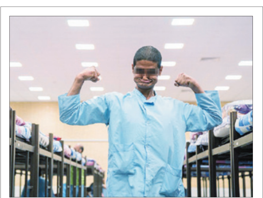
مسافغاری باشگاه خبرنگاران

بدون آنکه توضیح دهد این ۷۰۰ هزار نفر که به قدر جمعیت یک کشور هستند، دقیقاً کجا رفتند و چه شدند!