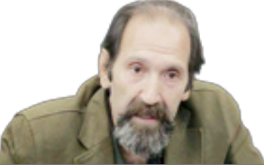
طرح: مصور محمدشیرازی جوان

به حاشیه راندن نخیشان و میدان دادن به میان‌مایگان، سکولاریسم پنهان را رواج می‌دهد