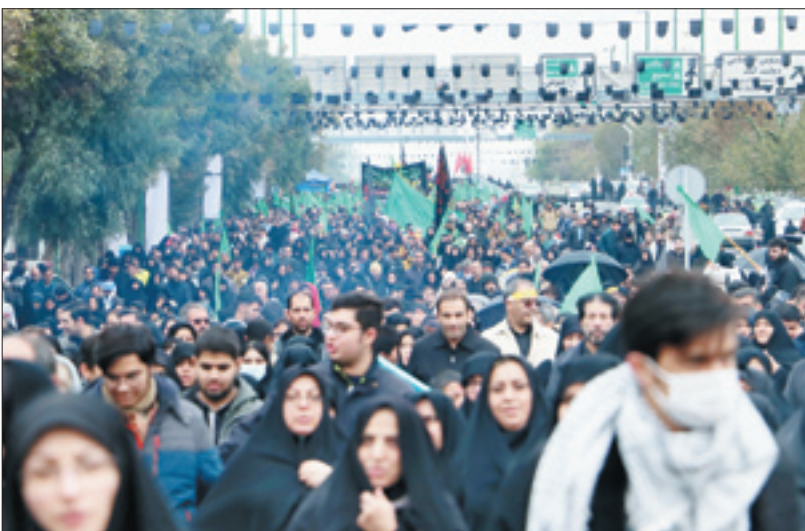
پیاده روی جاماندگان اربعین در نیران | عکس: محمد مهدی صافی | جوان