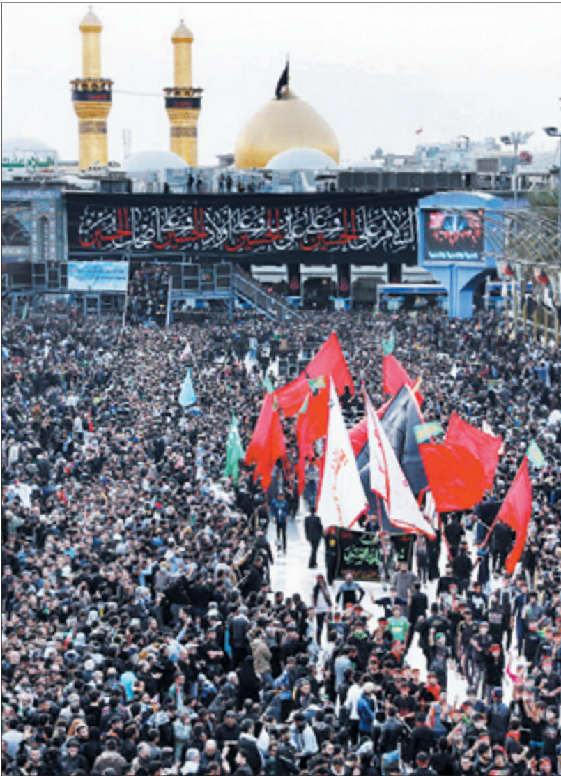
عاشقان در کوی دوست

آغوش کشیدند تا نشان دهند که ظلم هرگز پا برجا نخواهد ماند. راهپیمایی چندصد کیلومتری، رود خروشان عاشقان را به کربلا رساند و در پایتخت ایران هم امسال تهرانی‌های جامانده از کوی دوست، اما مشتاق یار، در هوای سرد و بارانی در روز اربعین حسینی با پای پیاده خود را از میدان امام حسین (ع) به حرم سیدالکریم حضرت شاه عبدالعظیم حسینی رساندند | صفحه ۲