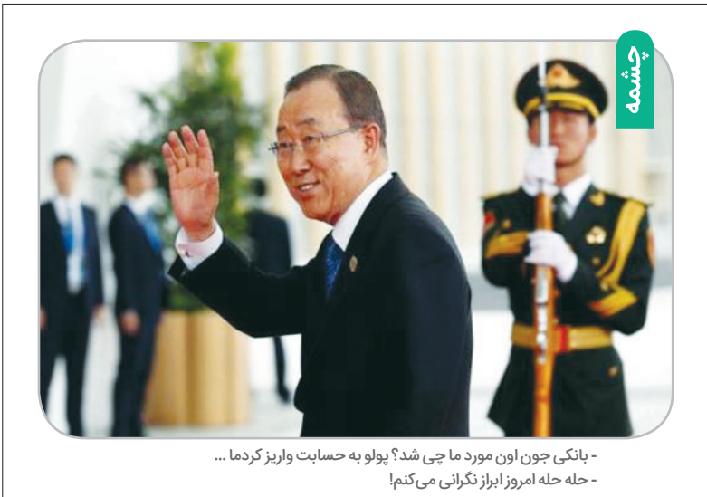
- بانکی چون اون مورد ما چی شد؟ پولو به حسابت واریز کرده ما ... - حله حله امروز ابراز نگرانی می‌کنم!

جوالدوز رئیس اتحادیه صنف ماشین حساب و چرتکه کشور از کاهش مصرف ماشین حساب در کشور خبر داد. مسعود رادیکال دو، اعلام کرد نرفتن حجاج ایرانی به کشور عربستان برای انجام فریضه حج باعث شده است تا عده‌ای از هموطنان نتوانند طبق سنوات گذشته با ضرب و تقسیم هزینه حج، آن را با قیمت جهیزیه، زمین ورزشی، یک وعده غذا و... مقایسه کنند و بگویند چرا این همه پول رو می‌ریزید توی شکم عرب‌ها! وی افزود: البته ما هر سال هنگام تعطیلات عید کلی ماشین حساب وارد می‌کنیم تا نیاز این دوستان برای محاسبه هزینه‌های آنتالیا، پاتا یا و... را برآورده کنیم اما معمولاً این ماشین حساب‌ها روی دستمان باد می‌کند. رادیکال دو اظهار امیدواری کرد با حضور دوباره ایرانیان در مراسم حج، مصرف ماشین حساب در بین روشنفکران افزایش پیدا کند!