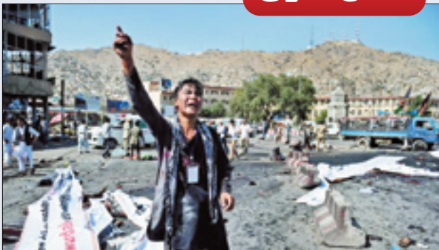
داعش تولید شده به دست امریکایی‌ها در کابل را با خون یکسان کرد