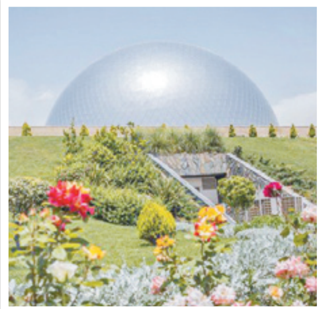
بمهر برداری از سینمای ۳۶۰ درجه‌ای دفاع مقدس در تهیه‌های عباس آباد