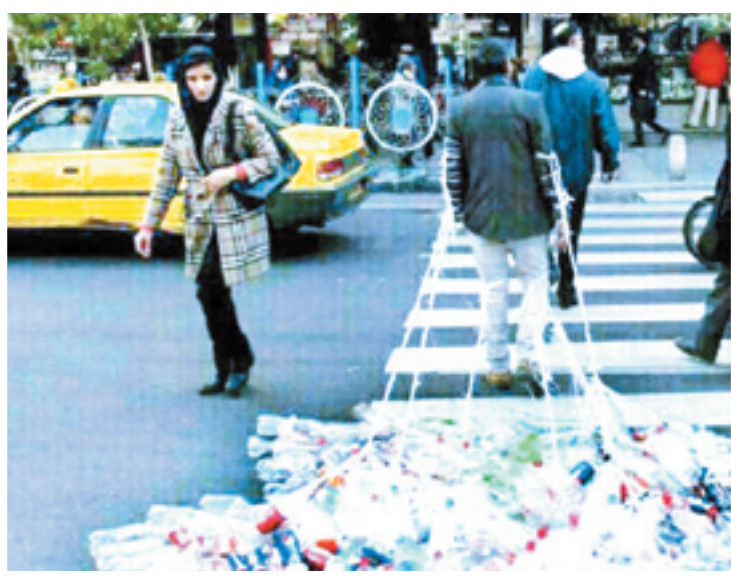
اعتراضی یک شهروند به ریختن زباله در معابر شهری

بسط و گسترش این اقدام سبب شده است تا نسل کنونی و نسل آینده را نیز برای حفاظت از طبیعت آماده سازد بر همین اساس لازم است تا بحث نظافت شهری نیز توسط شهروندان در حد یک حرکت نمادین آغاز شود و دستگاه‌های مختلف شهری نیز این اقدام را در دستور تقویم کاری خود قرار دهند و شهرداری