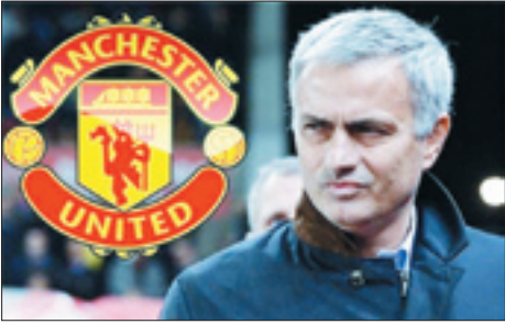
بودجه نجومی شیاطین سرخ در اختیار مورنیو