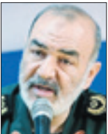
بزرگ‌ترین هنر انقلاب این بود که توانست دشمنان بزرگ را از پناهگاه‌های رهبردی خارج و به سطوح عملیاتی وارد کند.

به گزارش فارس، سردار حسین سلامی جانشین فرمانده کل سپاه در آیین افتتاحیه پانزدهمین همایش سراسری روحانیون شاغل در سپاه (میقات) با بیان اینکه ما با عصر حاکمیت جدید اسلام مواجهیم، تصریح کرد: انقلاب اسلامی در عصر سیطره قدرت‌های بزرگ بر جهان متولد شد و در همان روزهای اول، دنیای استکبار این‌الگوی جامع و موفق از ساختار حکومت دینی را برنافت و جنگی را بر ما تحمیل کرد.