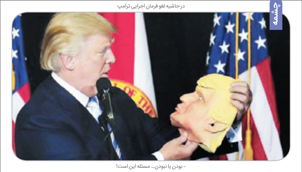
در حاشیه لغو فرمان اجرایی ترامپ

روزنامه اخبار ولایات محروسه وسط‌آباد نمره سی‌ام / بهمن ماه ۱۳۹۵