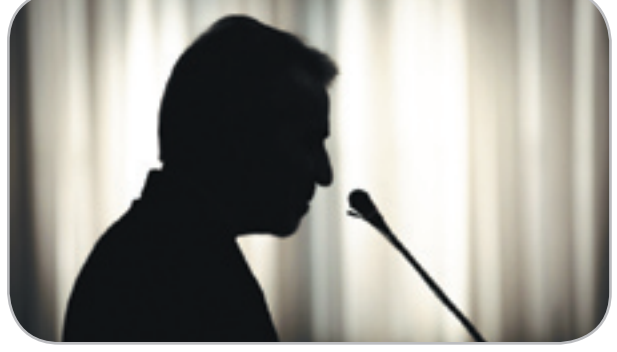
سخنگوی دولت در پاسخ به سؤال خبرنگاری درباره بحران آب و هوا و برق خوزستان، طی یک حرکت نمادین برق سالن را خاموش کرد!

ترامپ: ایرانی‌ها با آتش بازی می‌کنند هی ما هشدار می‌دیم که چهارشنبه‌سوری کارهای خطرناک نکنید، بفرما به کدخدا برخورد!