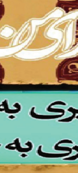
امام خامنه ای مدظله العالی

مسئول روابط عمومی سازمان پارکها و فضای سبز شهرداری کرج از برگزاری اولین سالانه نقاشی کودک و نوجوان استان البرز در محل خانه باغ فاتح خبر داد.