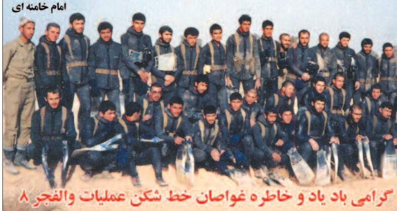
گرامی باد یاد و خاطره غواصان خط شکن عملیات والفجر ۸

جوان های شما لباس غواصی بر تن کردند . طوری که دشمن نفهمیده و نه ۱۰ متر و ۲۰ متر و ۱۰۰ متر بلکه ۱۳۰۰ متر را که عرض ترین بخش ابروند رود بود طی کردند و توانستند ساحل مقابل را از دست دشمن بگیرند و ان فتح الفتوح عجیب را یافایر بندند که دنیا را متقلب کرد.