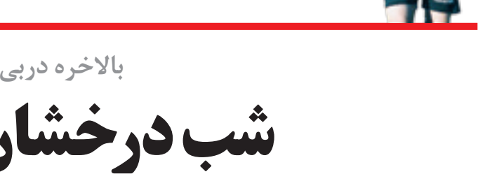
علی‌رضا فغانی داور سال جهان

علیرضا فغانی از سوی «گلوب ساکر اوردز» نامزد برترین داور سال ۲۰۱۴ جهان شد. در مراسم انتخاب برترین‌ها که هفته آینده در دویی بر گزار می‌شود داورانی چون فغانی (ایران)، نیکولا ریتزولی (ایتالیا)، بیورن کوپیزر (هلند)، ویونچی نیشیمورا(ژاپن)، جاننی سیکازو(ازببیا)،باکاری پاپا گالساما (گامبیا)، عبدالقادر زیتونی و نوربرت هالواتا(هر دو از تاهیتی)، ولبمار الکساندر رولمان (کلمبیا)، ساندرو میناریچی (برزیل)، روبرت گارسبا و مارکو آنتونیو رودریگز (هر دو از مکزیک) کاندیدای بهترین داور شده‌اند. این انتخاب‌ها هر سال بر گزار می‌شود و طی آن برترین باشگاه‌های اروپایی، برترین داوران و حتی برترین مدیر برنامه سال نامزد دریافت جایزه می‌شوند.فغانی از جمله داورانی بود که پس از ۳۶ سال انتظار بار دیگر از سوی فیفا در جمع داوران برگزیده جام جهانی قرار گرفت و از قضا داور ملی بسیاری هم خوبی هم اندیش فغانی به این هدف رسد می‌تواند. بربرزیل رفت اما همان مسئله باعث شد تا او الان در جمع نهم‌زده‌های بهترین داور قرار بگیرد. فغانی از جمله داوران جوان کشورمان است که بی‌شک اگر به عنوان بهترین داور سال جهان انتخاب شود، رصدها ساله را پیموده است.