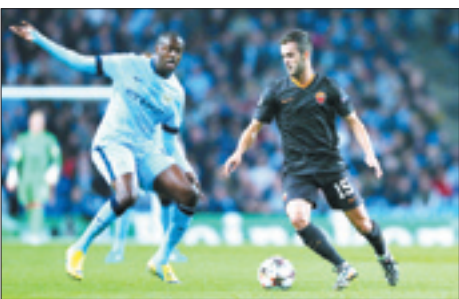
بازی فوتبال بین تیم فوتبال بارسلونا و تیم فوتبال آرسنال در ورزشگاه سانتیاگو برنابئو، ۲۰۰۶

رقابت در گروه Fاز حساسیت کمتری برخوردار است. در شرایطی که دو تیم صعود کننده این گروه از پیش مشخص شده‌اند بارسلونا و پی اس جی برای صدرنشینی رقابت شانه به شانه‌ای با هم دارند. تیم فرانسوی ۱۲ امتیازی است و آی واناری و رنشته‌های یک امتیاز کمتر دارند. همین مسئله موجب شده که هر دو تیم برای ثابت کردن قدرت خود به چیزی جز پیروزی فکر نکنند.