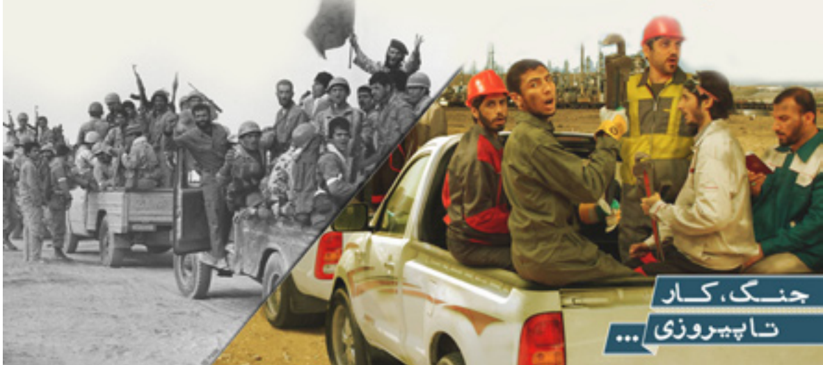
جنگ، کار تا پیروزی...