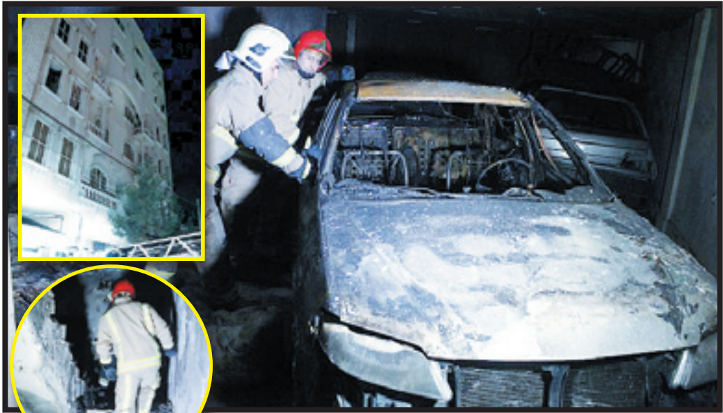
آتش‌نشانی‌ها در حال نجات دادن نوه خردسال و مادرش از آتش در ساختمان شماره ۹۸.

آتش‌نشانی مرا به بیرون از ساختمان خارج کردند. وقتی به هوش آمدم، خیلی ترسیده بودم و حال خوبی نداشتم که فهمیدم همسرم و نوام فوت شده‌ام.