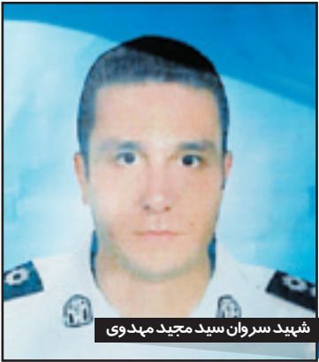
شهید سروان سید مجید مهدوی

درگیری سه نفر از پرسنل نیروی انتظامی به شهادت رسیدند و شش نفر هم مجروح شدند. وی ادامه داد: در ادامه تعقیب و گریزها ضاربان دو شهروند را هم به قتل رساندند. سردار آقاخانن گفت: ضاربان در مرحله اولیه ۳ نفر بودند که یک نفر از آنان در درگیری با پلیس در گلیایگان کشته شد و دو نفر دیگر متواری شدند و تحت تعقیب هستند که هنوز در جغرافیای استان حضوری دارند اما فعالیت پلیس در استان‌های همجوار نیز برای دستگیری ضاربان ادامه دارد.