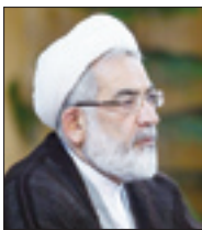
رئیس دیوان عدالت اداری

رئیس دیوان عدالت اداری گفت که با گذشت پنج سال از حادثه سال ۸۸ وقتی عده‌ای از غربی‌ها به ایران می‌آیند و مخفیانه ملاقاتی را با محکومان فتنه انجام می‌دهند، نشان می‌دهد، نشان می‌دهد آن فتنه در کجا ریشه داشته و ایشخور آن کجاست. منتظری بی بیان اینکه هیئت پارلمانی اروپا آمدند تا مشکلات اقتصادی و ارتباطی را حل کنند یا دنبال اهداف دیگری هستند، گفت: چه کسانی چنین خیانتی را مرتکب شده‌اند تا زمینه