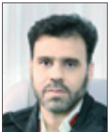
سردار سعید منتظرالمهدی