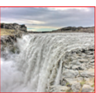
مخوف‌ترین آبشار جهان / ایسلند