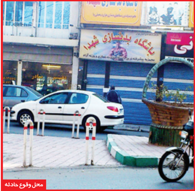
محل وقوع حادثه

پلیس همچنین از دو متهم یک اسلحه کلت پلاستیکی هم کشف کرد. بهمن در ادعایی گفت: من این اسلحه پلاستیکی را برای فرزندم از فروشگاه اسباب بازی خریدم. شب حادثه به دوستم در حال عبور از بزرگراه حقانی بودیم که دیدیم ماشین پرابدی در کنار بزرگراه توقف کرده است. بعد از این و سوسه شدیم تا از او زورگیری کنیم تا اینکه با تهدید همین اسلحه پلاستیکی مدارکش را به زور گرفتم. وی ادامه داد: روز بعد تصمیم گرفتم مدارکش را به او پس دهم. به خاطر همین دوبار با تلفن همراهش تماس گرفتمم تا اینکه سرقرار دستگیر شدم. وی در پایان گفت: ما سابقه سرقت نداریم و این اولین بار بود که اقدام به زورگیری کردیم. در پایان دو متهم به دستور قاضی هاشمیان برای تحقیقات بیشتر در اختیار کارآگاهان مبارزه با زورگیری قرار گرفتند.