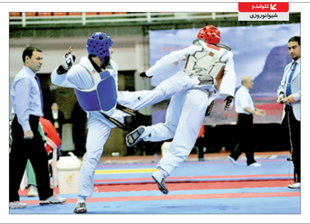
تکواندو شیوا نوروزی

استارت لیگ بر تر تکواندو زده شد و کسی به اعتراض سر مریب تیم ملی توجهی نکرد. دهمین دوره لیگ با حضور هشت تیم برگزار می شود و آنطور که رئیس فدراسیون تکواندو در مراسم افتتاحیه گفت قرار است امسال کمترین مشکل را در لیگ داشته باشیم. گویا با برگزاری این دوره با استقبال خوب